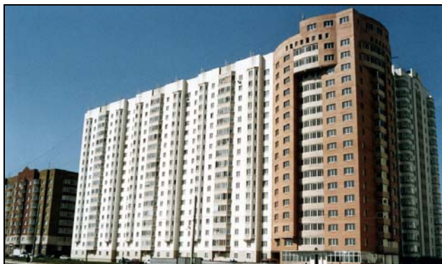
Neue Wohnhäuser in Kursk